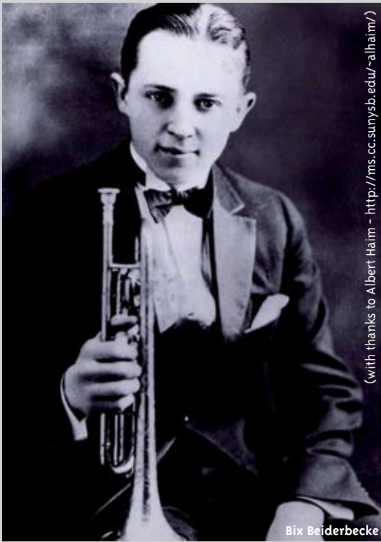
(with thanks to Albert Haim - http://ms.cc.sunysb.edu/~alhaim/ )